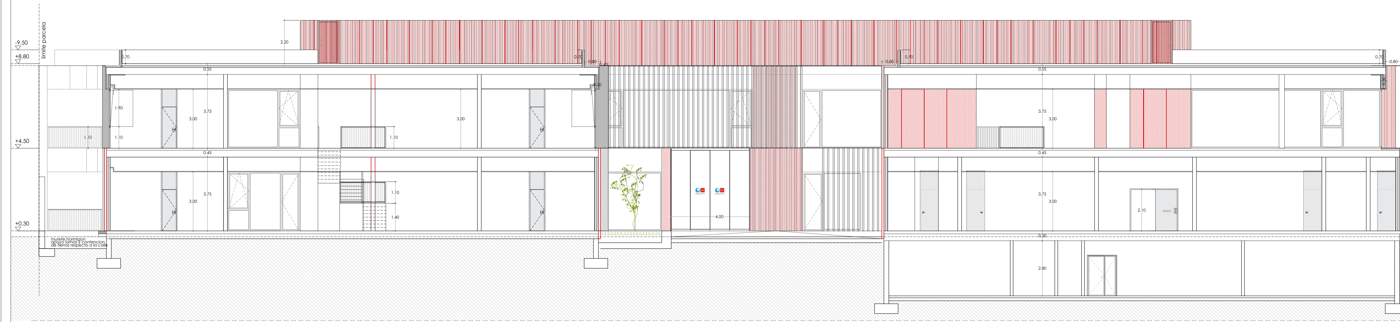
SECCION LONGITUDINAL 01"E:1/100